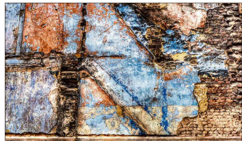
■ Afbraak en verval zijn inspiratiebronnen.